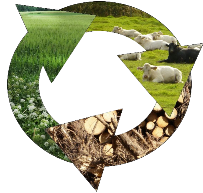
KiertoaSuomesta.fi -palvelun logo

Video: www.youtube.com/watch?v=1V_XS650lxg